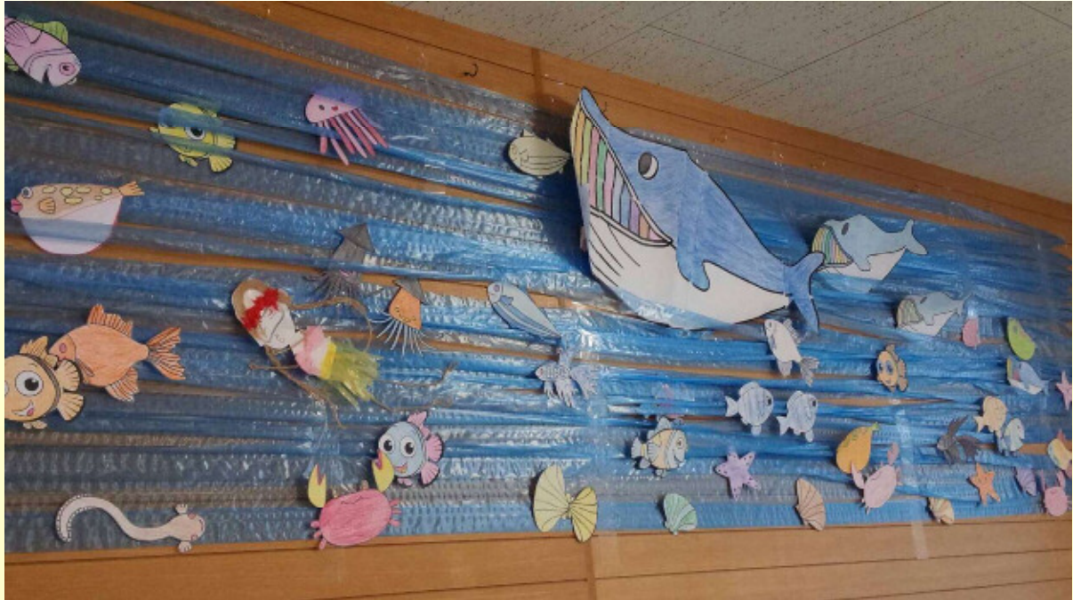
認知症A病棟 作品 より