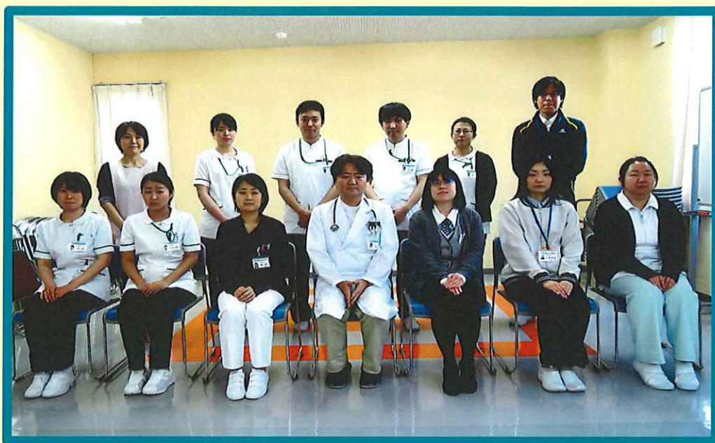
平成30年4月新採用者研修より

*****病院理念***** 私たちは地域の方々に愛され 安心して利用できる病院を目指します *****