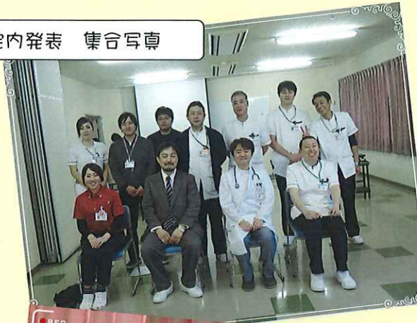
院内発表 集合写真