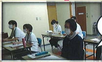
新採用者研修 授業風景

4月1日、2日の2日間にわたり、平成31年度新採用者研修を開催しました。職種は看護師7名、准看護師1名、介護福祉士1名、相談員1名、事務員1名、清掃員1名の計12名が入職となりました。