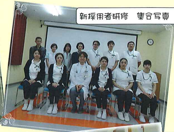
新採用者研修 集合写真